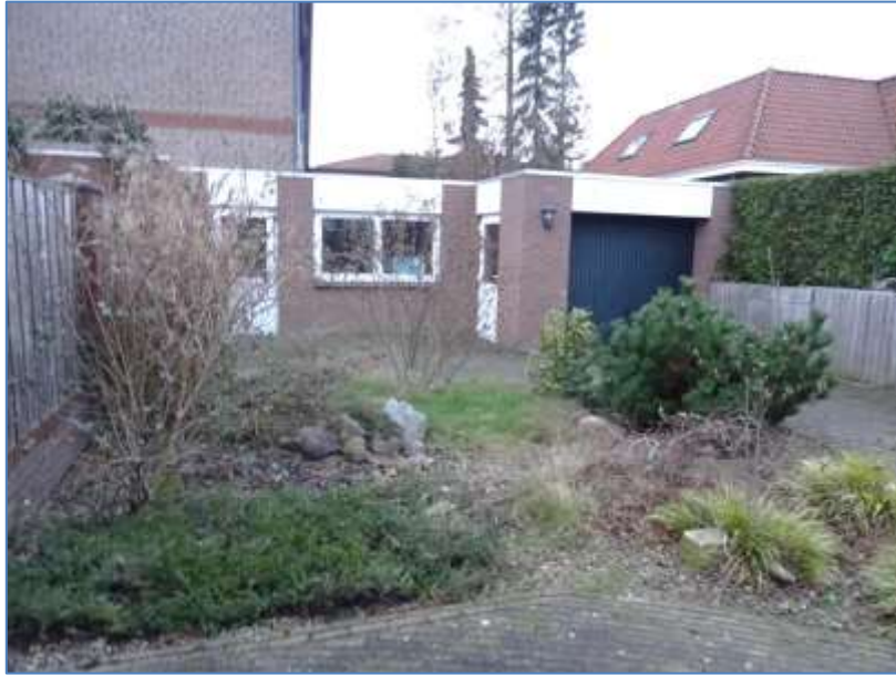
Garage en hobby-ruimte