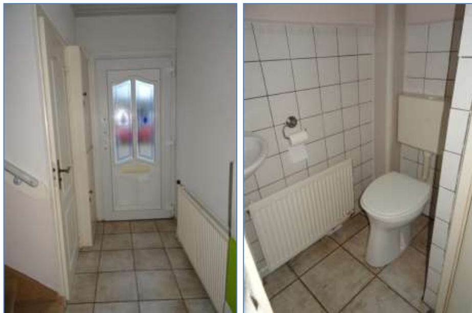
Gang en toiletruimte