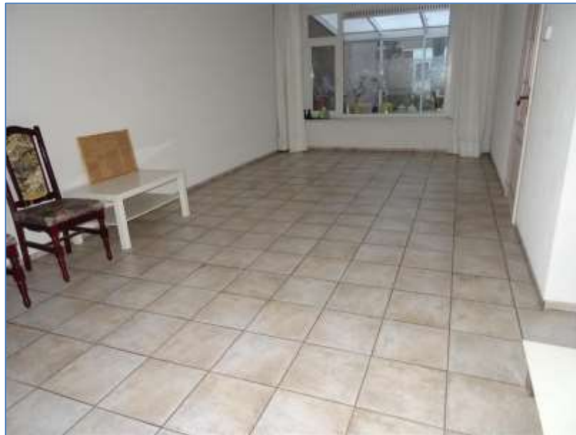
Woonkamer en serre