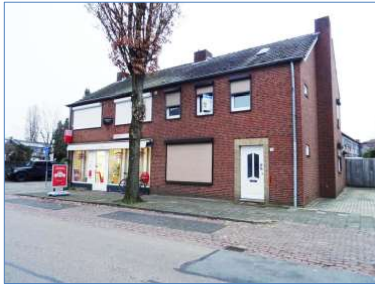
Voor- en achterzijde